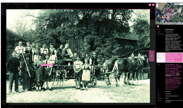
Über die Rückmeldefunktion in den beschlagworteten Detailansichten können die Besucher mit ihrem Wissen laufend zu einer Vervollständigung einer Topothek beitragen.

Die Arbeit in der Topothek ist sie so einfach wie möglich. Dennoch erfüllen die Einträge die europäische Norm, sodass die Daten über das NÖ Landesarchiv in das ArchivNet eingespielt werden. Die Unterstützung durch die NÖ Dorf- & Stadterneuerung macht die Einrichtung einer Topothek zu einer leistbaren kulturellen Initiative für jede Gemeinde.