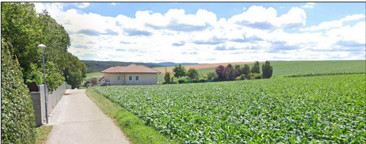
Abbildung: Ausschnitt aus Google Street View, Blickrichtung Süden auf das bestehende „Bauland-Wohngebiet – max. 3 Wohneinheiten“ – Stand Juli 2024

Für den Änderungspunkt 11 kann Folgendes angeführt werden: