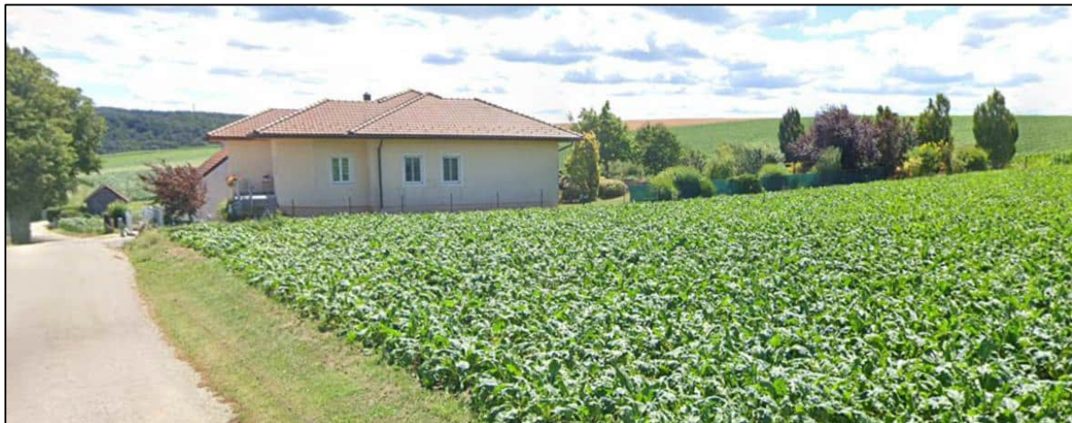
Abbildung: Ausschnitt aus Google Streetview (Stand 07/2024) vom Bereich der geplanten „Grünland – Grüngürtel – Emissions-/Immissionsschutz (Ggü-1)“- und „Bauland – Agrargebiets (BA)“-Widmung; Blickrichtung Süden