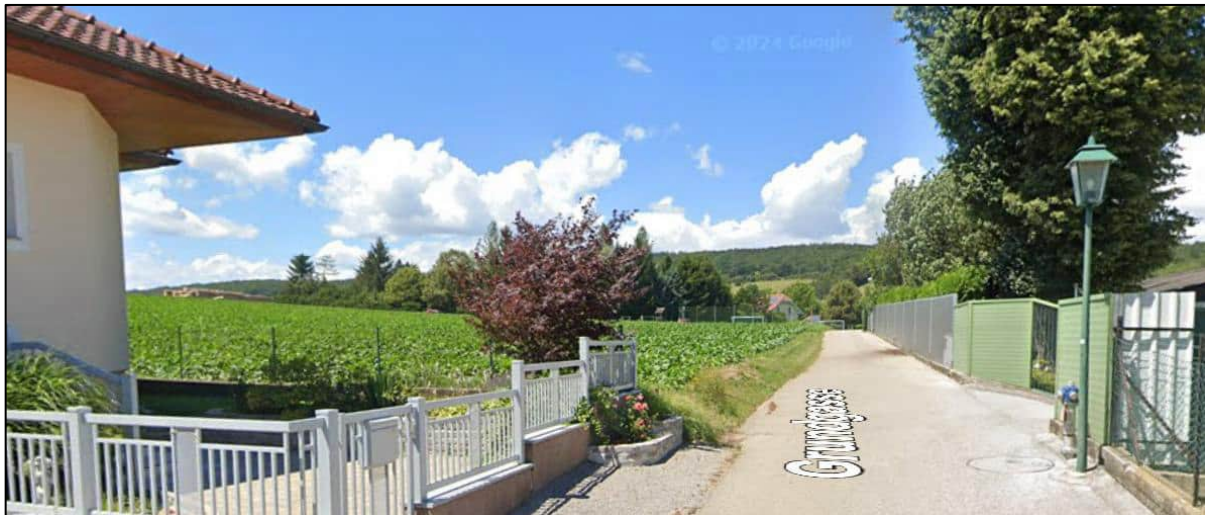
Abbildung: Ausschnitt aus Google Street View, Blickrichtung Norden, die geplante „BA“-Widmung befindet sich auf der linken Bildseite im Anschluss an das Einfamilienhaus– Stand Juli 2024

Die geplante „BA“-Neuwidmung befindet sich zwar in siedlungsstruktureller Randlage, jedoch im Anschluss an bebaute Baulandflächen. Es umfasst die Schaffung eines Bauplatzes, der das Bauland südwestlich der „Grundgasse“ Richtung Norden abrundet. Obwohl das Gelände nach Norden hin ansteigt, sind im Hinblick auf die angestrebte Widmungsänderung (Ausmaß der „BA“ Widmung beträgt lediglich rd. 700m 2 ) keine erheblich negativen Auswirkungen auf die Landschaft bzw. die Sichtbeziehungen zu erwarten.