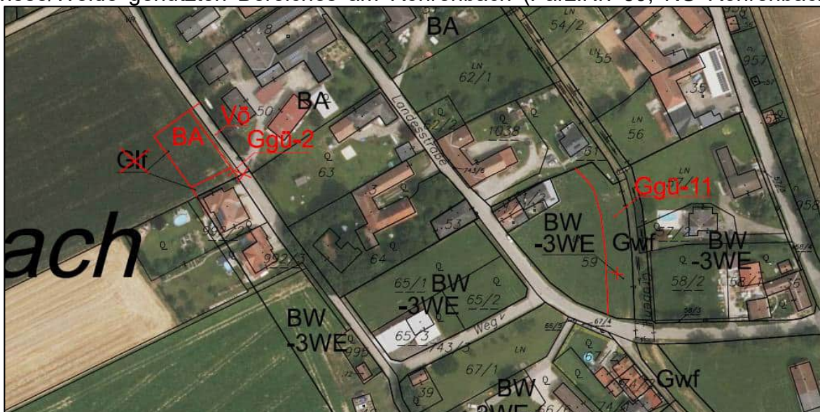
Abbildung: Maßstabsloser Ausschnitt aus dem Änderungsentwurf zum Flächenwidmungsplan mit Orthofoto 2023

In Tabelle 2 des „Screenings“ wird festgestellt, dass durch die geplante Abänderung - auch im Hinblick auf geschützte Pflanzen- und Tierarten gem. NÖ Artenschutzverordnung (LGBI.Nr. 5500/2 idGF.) - keine relevanten Auswirkungen zu erwarten sind. Der Bereich der vorgesehenen Baulandneuwidmung ist derzeit intensivlandwirtschaftlich genutzt. Gemäß Abfrage des Agrar-Atlas wird Winterweichweizen angebaut (Stand 21.4.2026). Da die betreffende „BA“-Neuwidmung im Ausmaß von 620m 2 („Vö“-Neuwidmung umfasst rund 220m 2 ) keinen direkten Anschluss an ökologisch hochwertige Grünflächen aufweist und keine besonders naturnahe oder ökologisch wertvolle Ruderalfläche darstellt, ist daher im Zusammenhang mit der geplanten Wohnbaulandneuwidmung kein Widerspruch zur NÖ-Artenschutzverordnung festzustellen. Viel mehr ist die Widmungsbestrebung wegen der gleichzeitig vorgesehenen Bauland-Rückwidmung (Flächenabtausch) von rund 840m 2 im Bereich eines derzeit als Mähwiese/Weide genutzten Bereiches am Röhrenbach (Parz.Nr. 59, KG Röhrenbach)