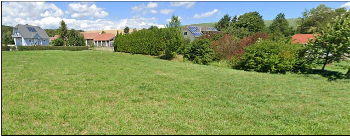
Abbildung: Ausschnitt aus Google Streetview (Stand 07/2024) vom Bereich der geplanten „Grünland – Grüngürtel – Uferfreihaltung (Ggü-11)“-Widmung; Blickrichtung Norden

diesbezüglich positiv zu bewerten, da bei einer Mähwiese bzw. Weide von einer höheren ökologischen Bedeutung gegenüber einem Winterweizenfeld ausgegangen werden kann.