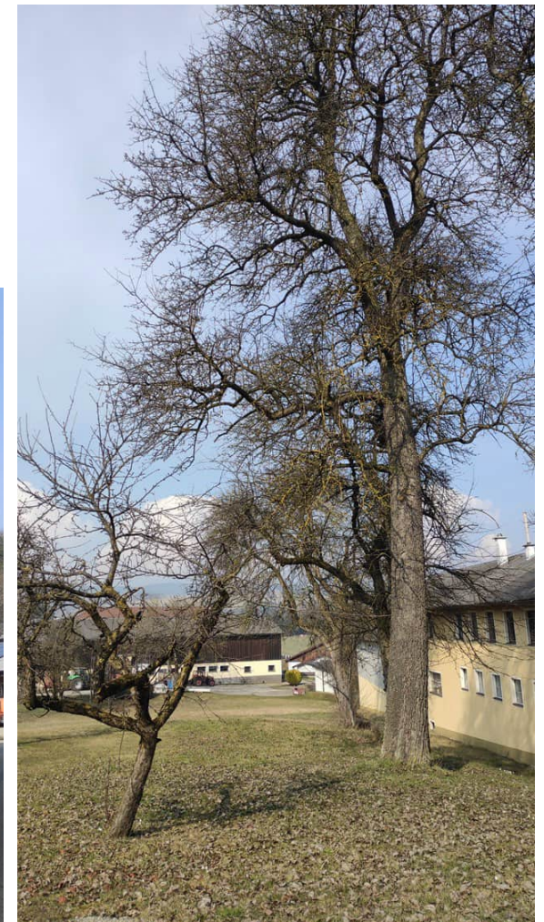
Hauptsächlich Obstbäume (Apfel, Birne, Zwetschke u.Ä.) großteils älteren Alters vorhanden.