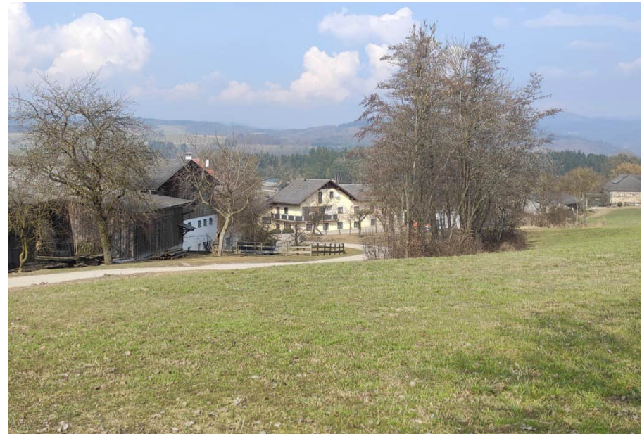
Typische Feldhecke mit unter anderem Haselnuss und Erle, ev. Hainbuche östlich der Straße im südlichen Teil