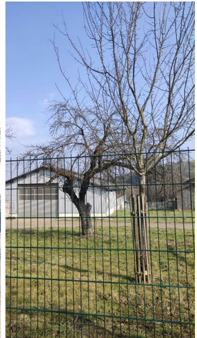
Hauptsächlich Obstbäume (Apfel, Birne, Zwetschke o.Ä.) gemischten Alters vorhanden.