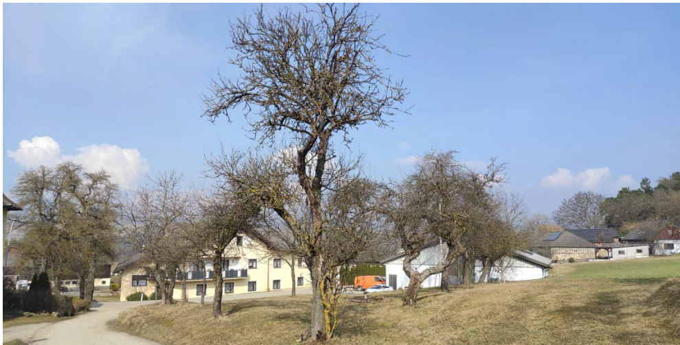
Im nördlichen Teil wieder typische ältere Streuobstbaumwiese