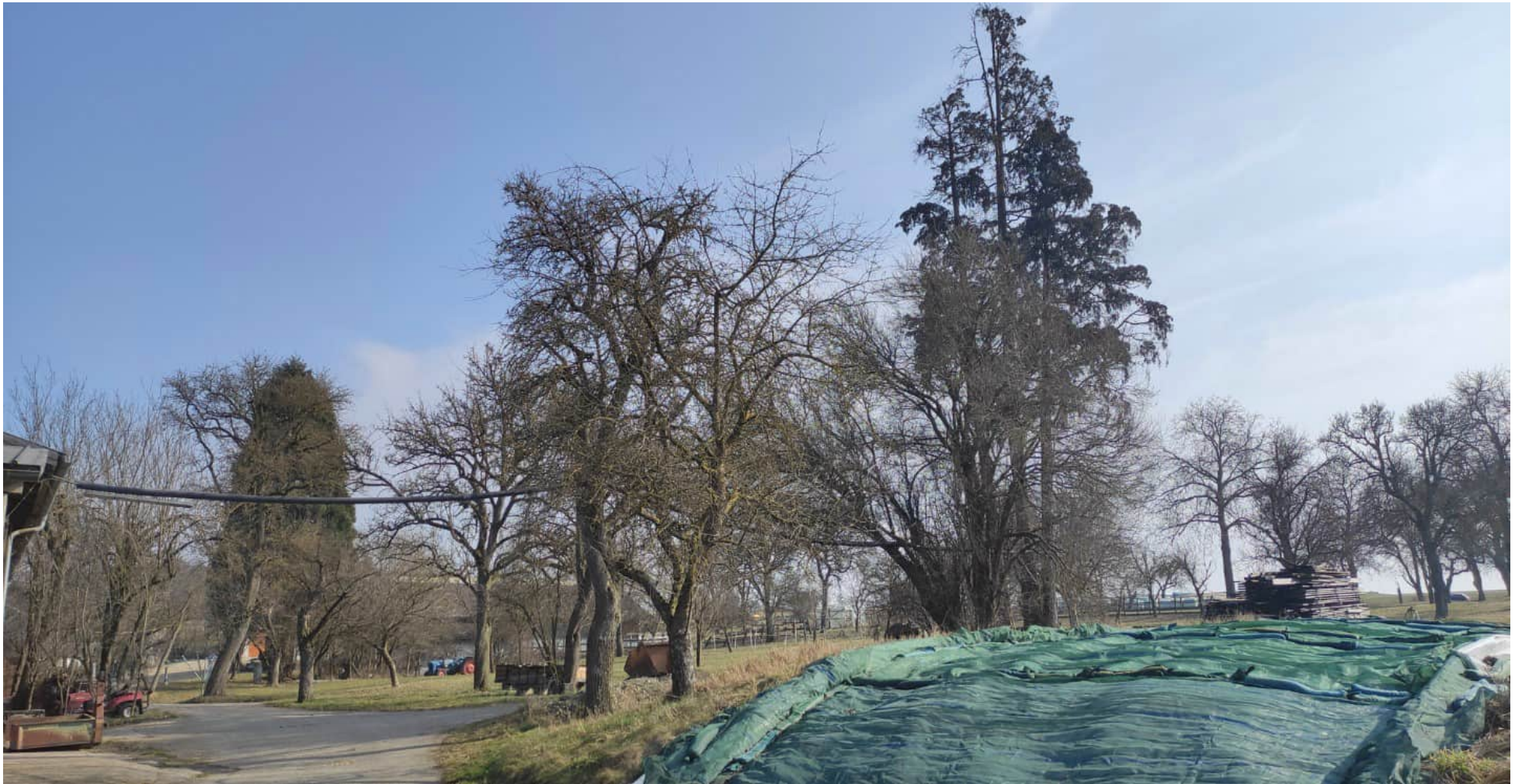
Wieder hauptsächlich ältere und mittelalte Obstbäume, gemischt mit vereinzelt größeren Nadelbäumen